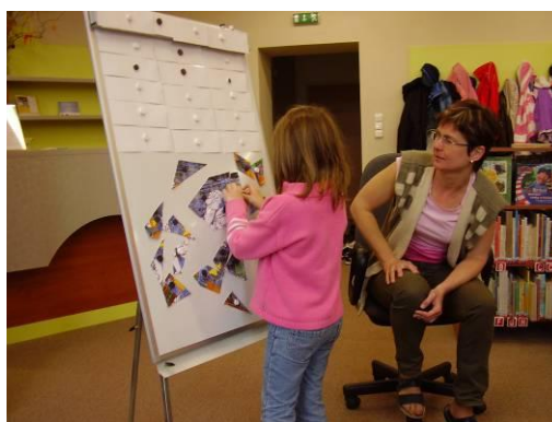
Návštěva Knihovny B. Benešové