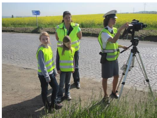
Den s Policií ČR

Všichni vyučující 1.stupně tvořili příspěvky na webové stránky školy.